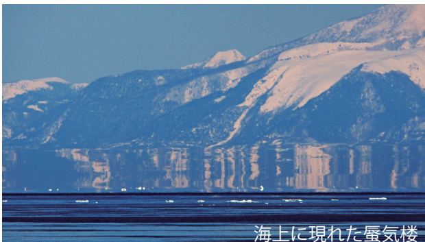
海上に現れた蜃気楼