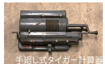
手廻し式タイガー計算器

3月の休館日：6日(月)、13日(月)、20日(月) 21日(火・祝)、27日(月)